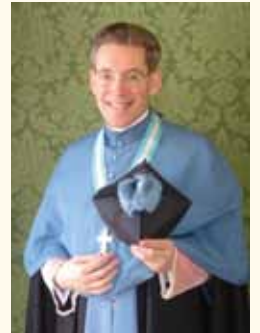
Bayerisch Gmain, im November 2013

Liebe Freunde des Instituts Christus König und Hohepriester,